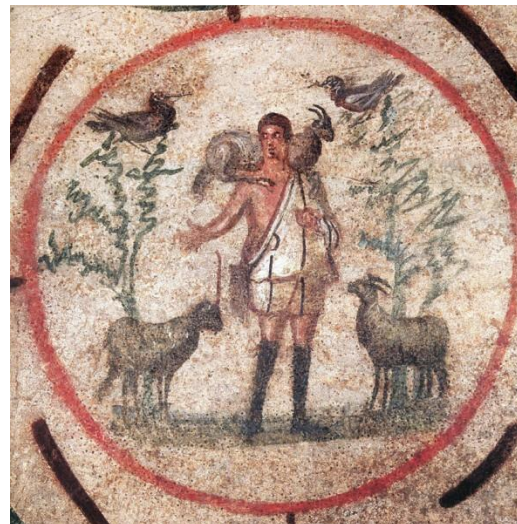
Image catacombe Ste Priscilla Rome 1 er siècle