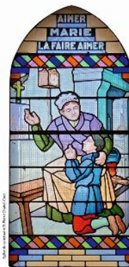
SAINT PIERRE CHANEL 1803 - 1841

SANCTUAIRE SAINT PIERRE CHANEL - CUET 04 74 30 00 50 - accueil@paroisse-montrevel.fr